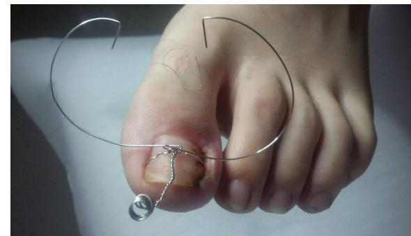
Fot. 3 Mężczyzna lat 18, 22.01.2016

Klinika Art-Medica w Poznaniu prowadzi szkolenia w zakresie aplikacji systemu Podoklamra. Szkolenie obejmuje siedem czterdziestopięciominutowych modułów i po jego odbyciu kursanci nabywają umiejętność samodzielnej aplikacji