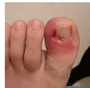
Fot. 2 Mężczyzna lat 18, 01.12.2015

Główną zaletą klamry jest prawie natychmiastowe działanie przeciwbólowe, polegające na odciążeniu miejsca ucisku paznokcia na wał. Działanie klamry powoduje spłaszczenie płytki paznokciowej i jej powolne prostowanie.